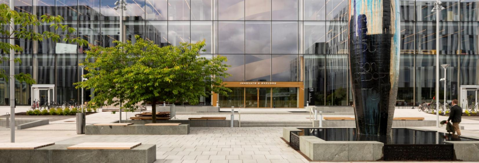
Aker Tech House på Fornebu